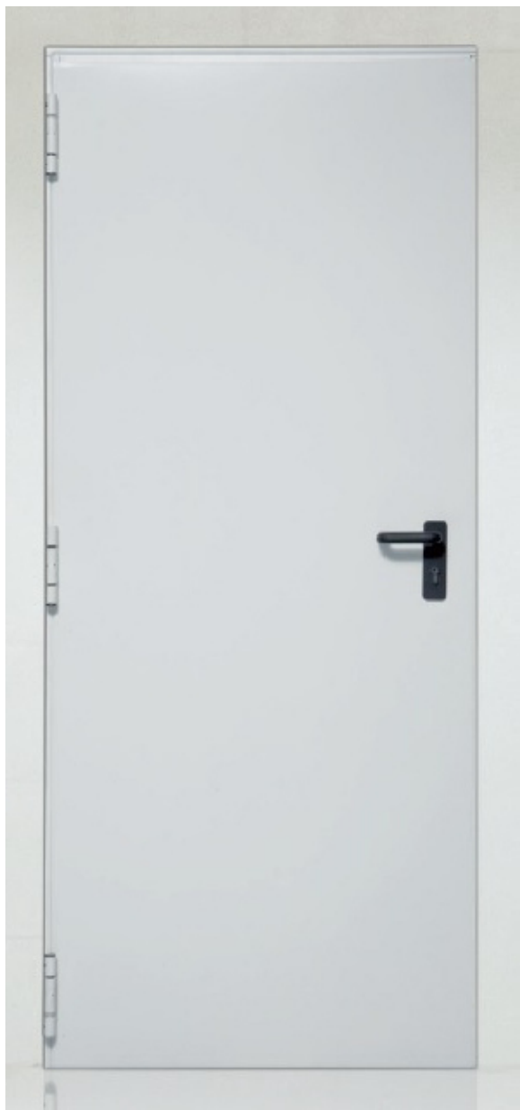
SLIKA PP VRATA "SPLIT REI 120" U STANDARDNOJ BOJI